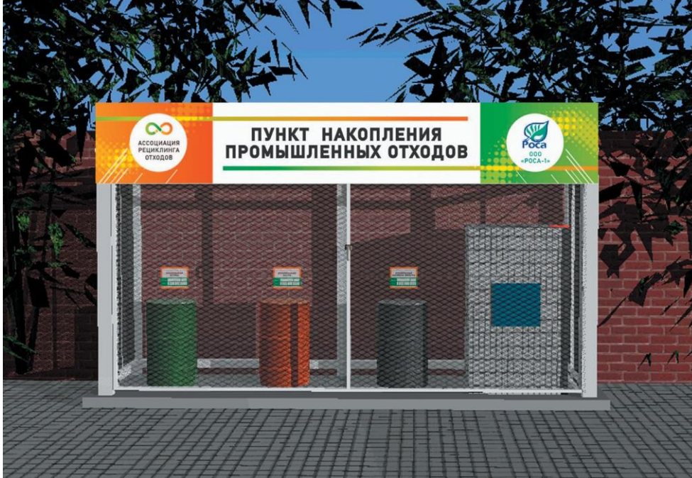
Рис. 2. Пункт накопления отработанных масел

Доля партнеров АРО в общем объеме произведенных и импортируемых в РФ товарных масел за 2020 г. составила 1 205 140 т , или 69 % рынка . Кроме того: